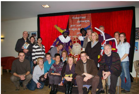
Het Oscare team