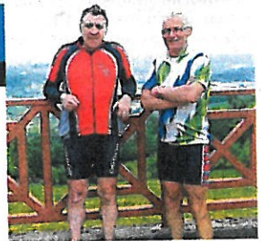
Op weg naar Compostela.