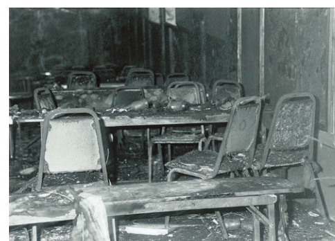
De Switel-brand.

1987: het brandwondencentrum verhuist naar de vierde verdieping van het Stuivenbergziekenhuis. Voortaan zijn er zes bedden voor zwaar verbrande patiënten. Het brandwondencentrum is een gesloten afdeling binnen het ziekenhuis. Jarenlang gelden er strenge omkleedprocedures om infectiegevaar tegen te gaan.